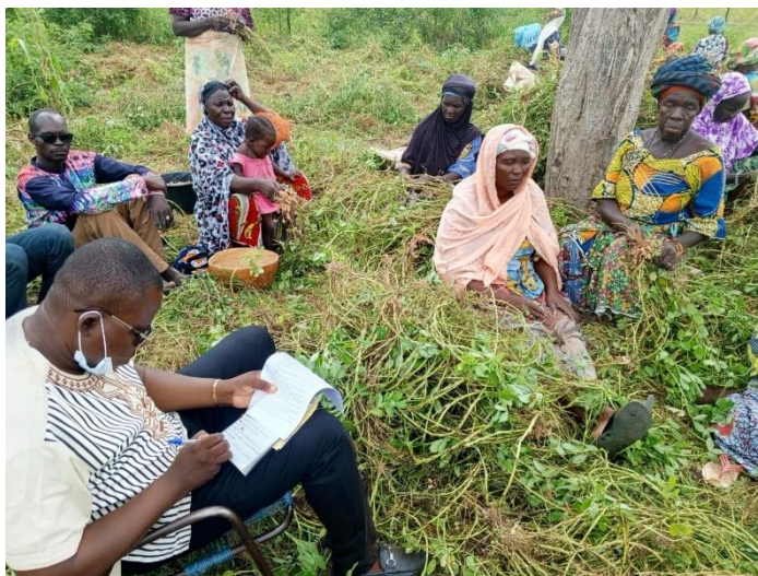
Entrevista con las mujeres de Sirakélé 1

Según las mujeres, el proyecto ha supuesto un cambio positivo en su comportamiento cotidiano. Ahora tienen un lugar donde pueden hablar entre ellas, y el espíritu empresarial es más fuerte, al igual que la cohesión y las expectativas. Consideran que el objetivo del proyecto se ha cumplido, porque la seguridad alimentaria está garantizada, ya que la gente