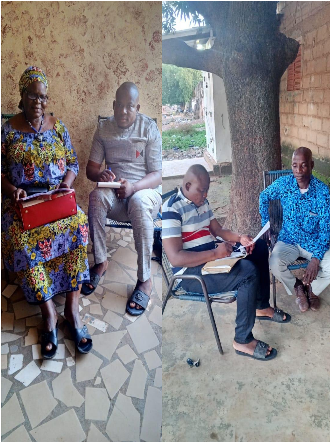
Photos de quelques entretiens (SCOFI à gauche et Maire de Sorobasso à droite)