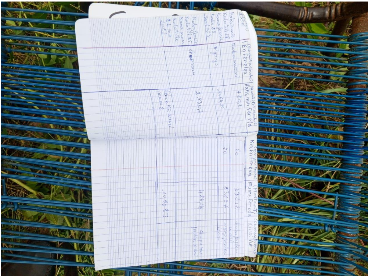
Exemple cahier de vente dans le périmètre de Sirakélé