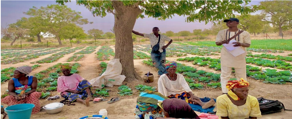
Fotos de los perímetros hortícolas de Signé (arriba) y de Sirakélé (abajo)