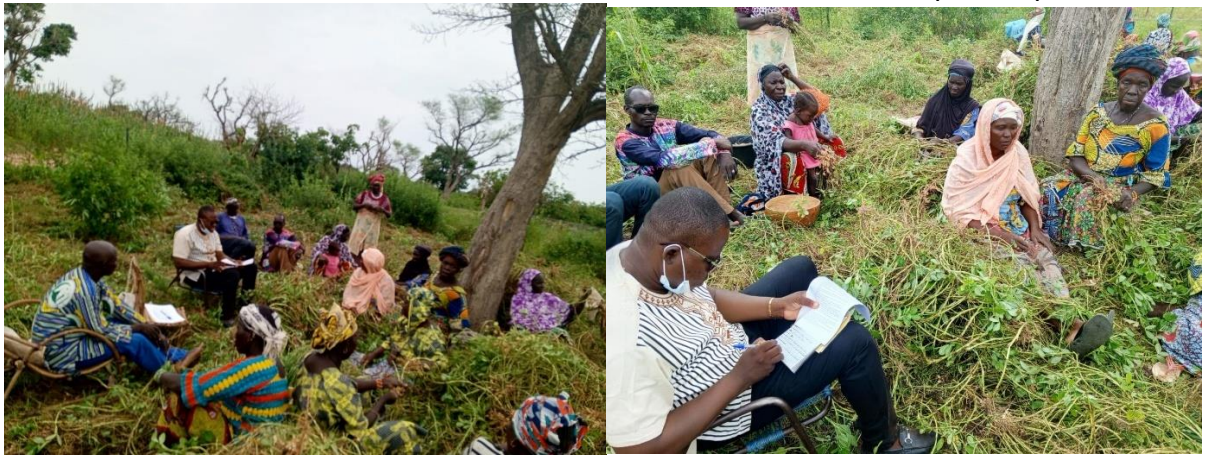
Collecte de données dans le périmètre de Sirakélé pendant la récolte de l'arachide