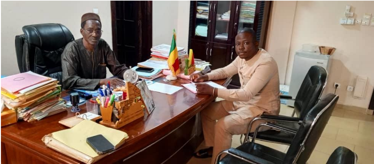
Image de la rencontre entre l'enquêteur et le maire de la commune urbaine de Koutiala