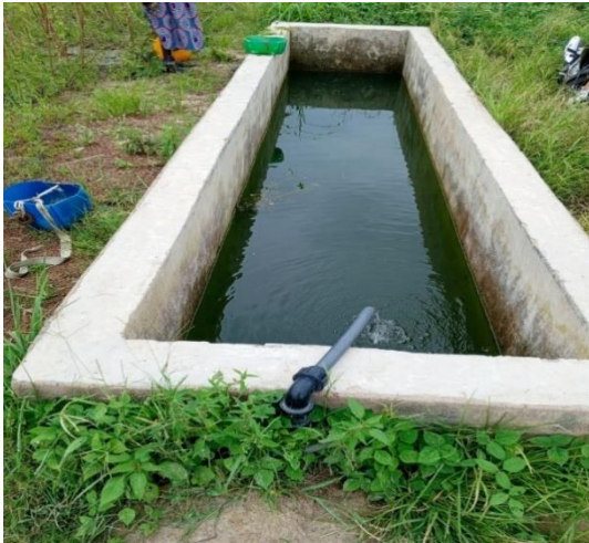
Ejemplo de balsa de almacenamiento de agua en un perímetro

Según lo previsto, se han construido cuatro balsas de almacenamiento de agua en cada uno de los tres pueblos de Farakala, Sirakele y Fandiela . Estas cuencas están previstas en las tres zonas donde el proyecto ha construido pozos de sondeo.