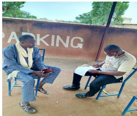
Entrevista con el alcalde de N'Gountjina 1

Es evidente que ONG MZC, que hace más de diez años ha participado en la ejecución de varios proyectos del proyecto es la impulsadora de las cantidades químicas se