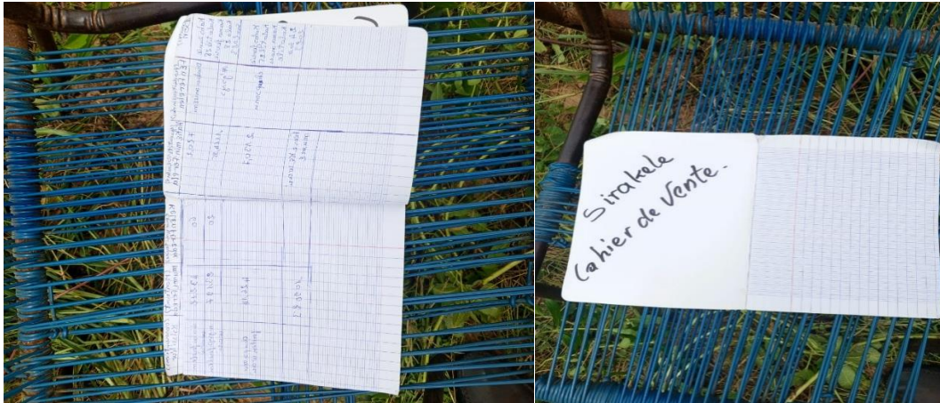
Ejemplo de cuaderno de ventas en una de las zonas del proyecto