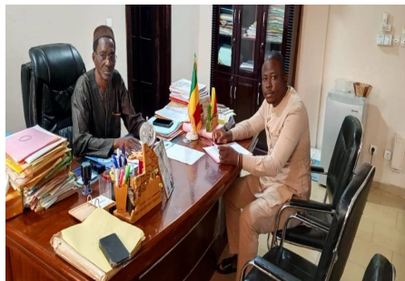
Entrevista con el alcalde de Koutiala 1

Todos los productos cultivados en la zona gestionada por MZC son 100% ecológicos. En cada una de las zonas, el trabajo se ha aligerado gracias a la instalación de una bomba equipada con una bomba de este proyecto, MZC ha mejorado las condiciones de vida de la alimentación y actividad de las zonas de huerta, las mujeres más y ganan entre 250.000 y 300.000 francos CFA por cosecha.