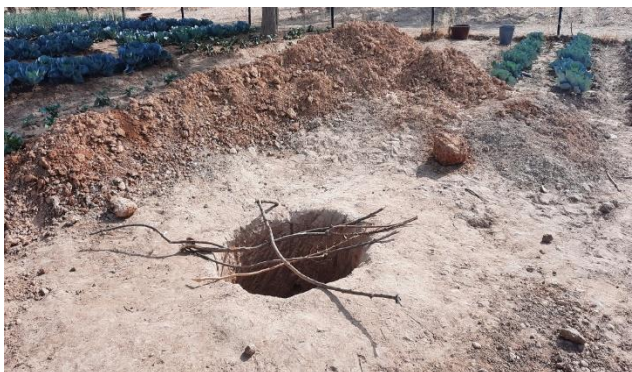
Construcción de un pozo en el perímetro de Sirakelé por el alcalde de la comuna

Cada una de estas tres perforaciones se ha equipado con módulos solares y bombas que abastecen las balsas de agua, con el objetivo de reducir la dificultad de la actividad de riego para las mujeres y el tiempo que le dedican.