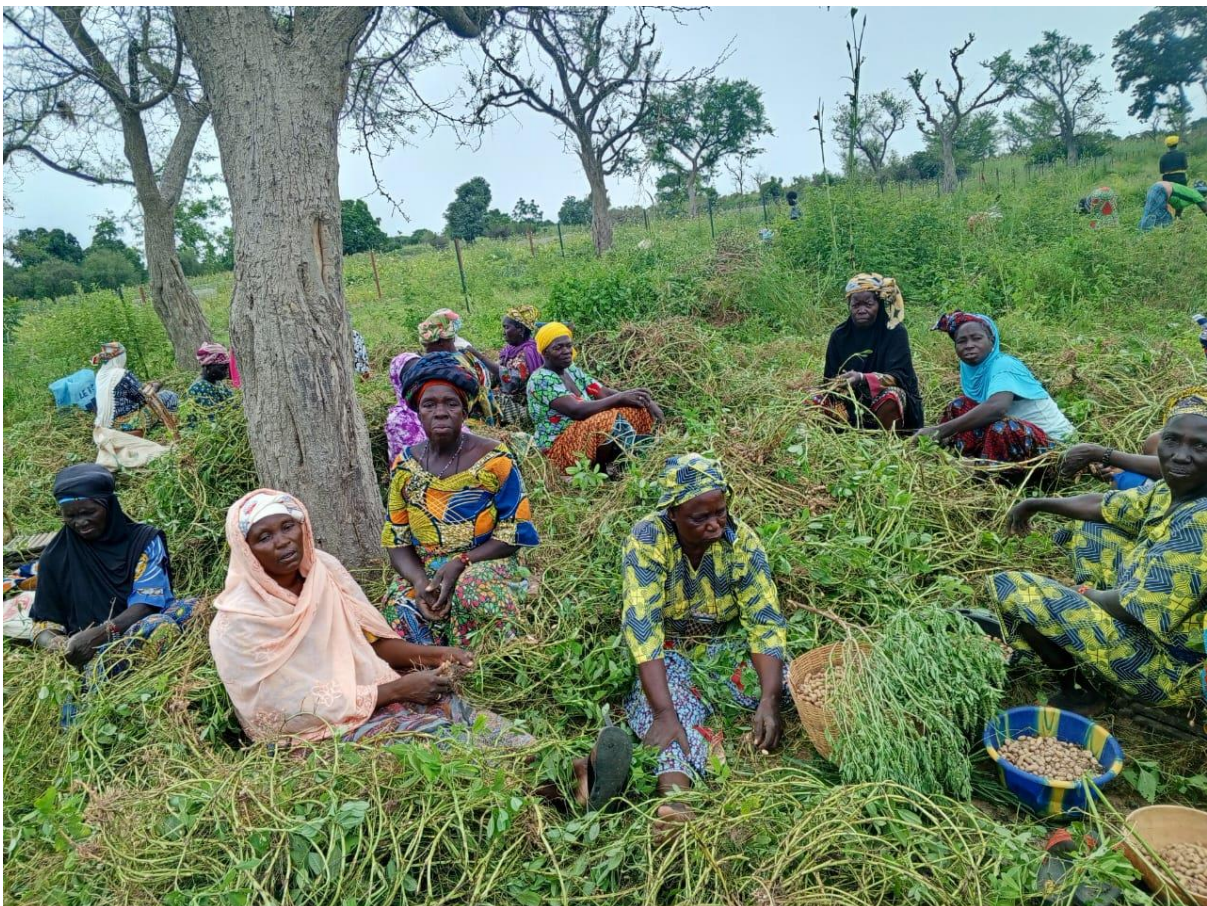
Récolte de l'arachide dans le périmètre de Nizanso