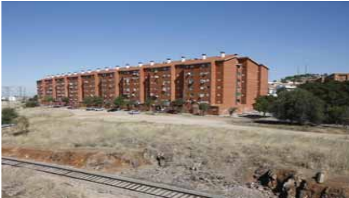
Aldea Moret, en Cáceres