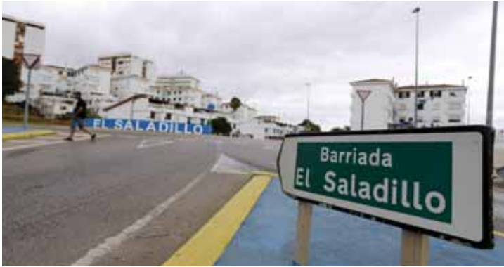
El Saladillo, en Algeciras