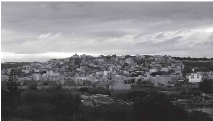
Cañada de Hidum, en Melilla